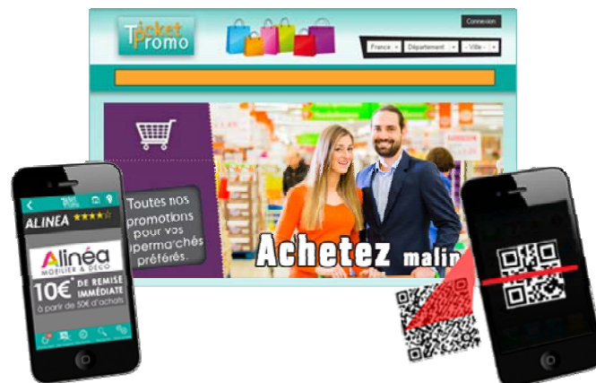
Des plates-formes complémentaires

L'accès aux enseignes est également facilité grâce à l'intégration d'un système d'itinéraire et des horaires d'ouverture de chaque point de vente.